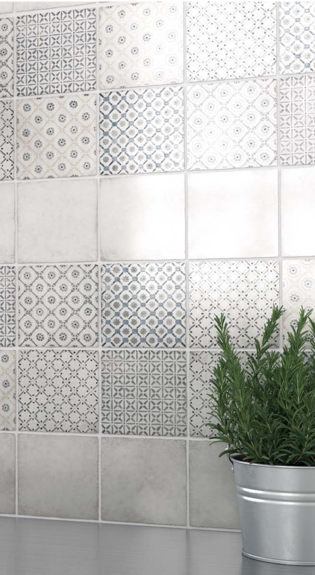
◀ Vestige Old White, Spring Cool Grey 13,2 x 13,2 cm / 5" x 5"