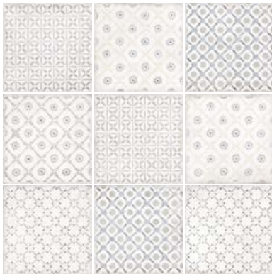
SPRING COOL GREY 24144 EQ-10D