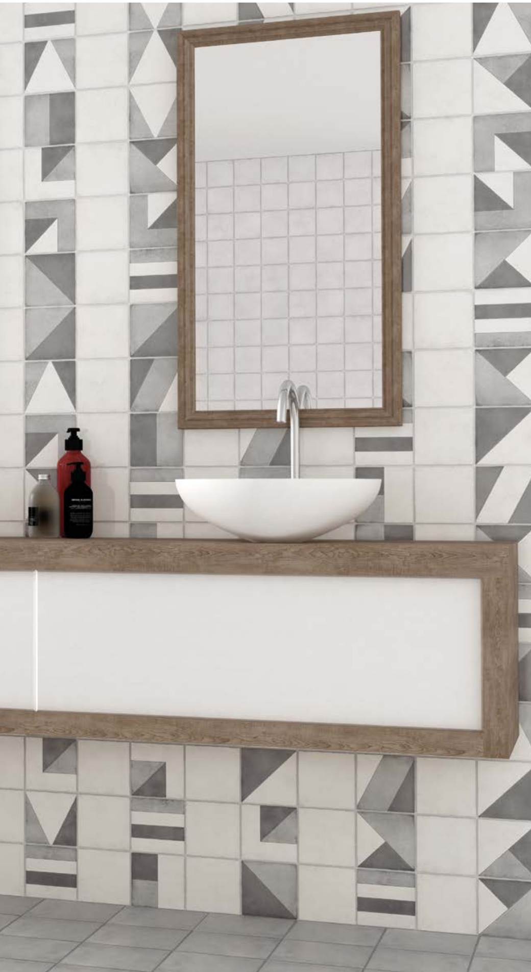
◀ Vestige Old White, Tangram Cool Grey 13,2x13,2 cm / 5" x 5"