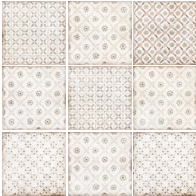
SPRING LIGHT UMBER 24145 EQ-10D